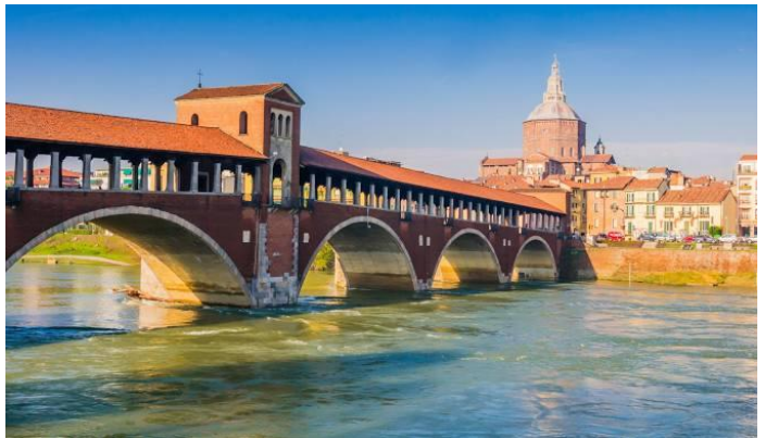
Pavia, Ponte Coperto

Après notre dernier déjeuner en Italie (à Milan ou à Pavie), retour à Toulon pour y arriver en soirée.