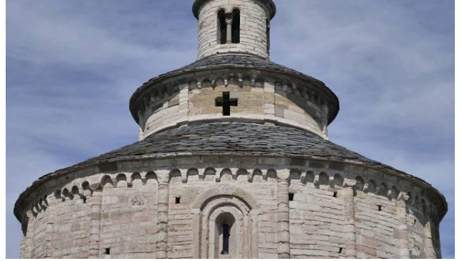
Rotonda di San Tomè