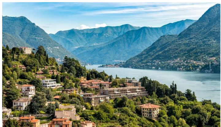
Lac de Côme