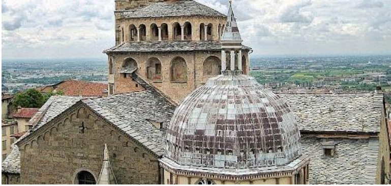
Bergamo : Basilica di Santa Maria Maggiore

L'après-midi, visite des 3 (voisins entre eux) joyaux romans d' Almenno : la célèbre Rotonda San Tomè , San Giorgio in Lemine et la Madonna del Castello .