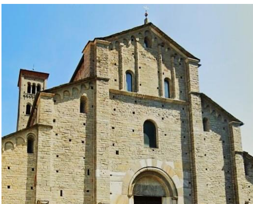
Como (Côme), Basilica di Sant'Abbondio

En fin d'après-midi, visite de San Vincenzo de Galliano , chef-d'œuvre du premier art roman, à Cantù.