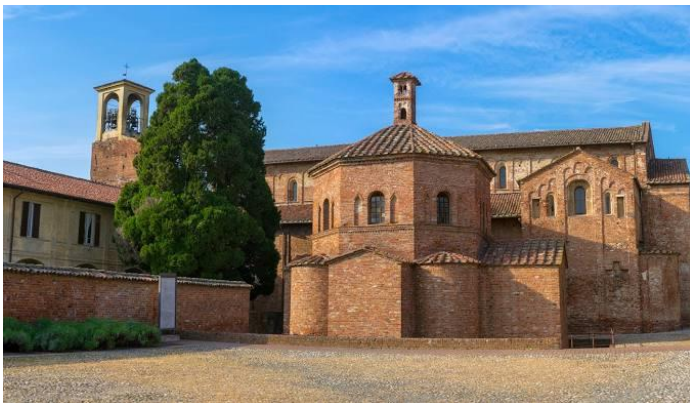
Lomello, Basilique & (par devant) Baptistère

Visite à Lomello (Lumelle) , visite de San Giovanni (basilique et baptistère adjacent), magnifique illustration du tout premier art roman en Lombardie.