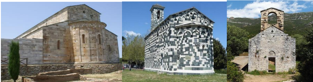
La Canonica Bastia