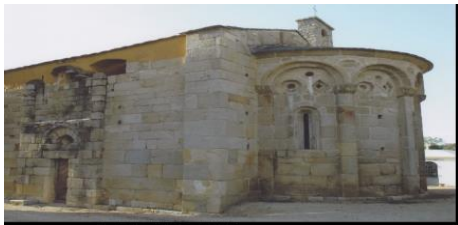
San Pietro e Paolo