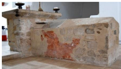
Santa Restituta sarcophage Paléochrétien San Giovanni